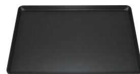
⑧ フッ素加工 ヨーロッパ軽量天板