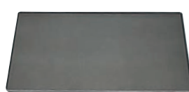
⑦ ノンスティック アルミ ベーキングシート