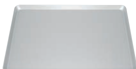
⑭ アルマイト加工 ヨーロッパ軽量天板