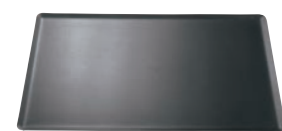
⑥ デバイヤー アルミ ノンスティック ベーキングシート